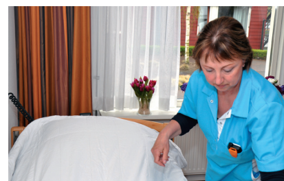
● Avec pince à ressort solide