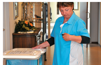
● Signal d'alarme sans délai

Il y en a trop pour décrire toutes les possibilités du Pager2 dans cette brochure. Laissez-vous informer par votre distributeur ou Abilanx et découvrez l'énorme flexibilité du Pager2.