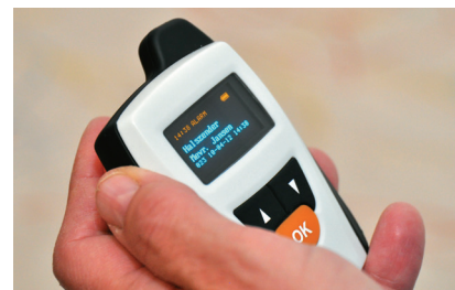
● Identification de la chambre et la personne