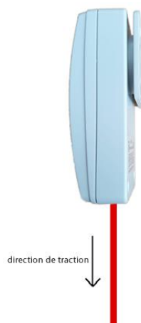
Figure 1: alerte