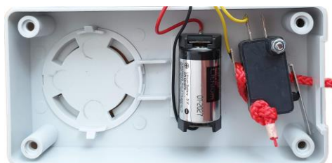
Figure 3: Emplacement de la batterie

Abilanx Park Avenue Rue Léon Griffon 56890 Saint Avé Tél : 02 97 63 70 46 Fax : 02 97 63 74 90 Courriel : contact@abilanx.com Web : www.abilanx.com